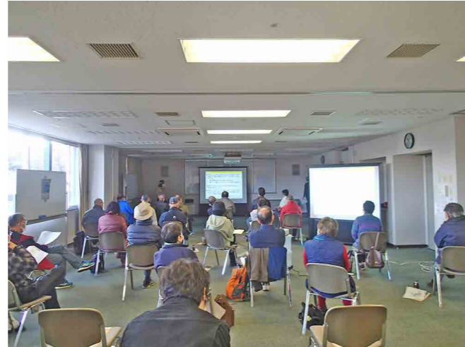
サイエンスカフェ会場の様子